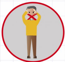
РАК ГУБЫ, ЯЗЫКА