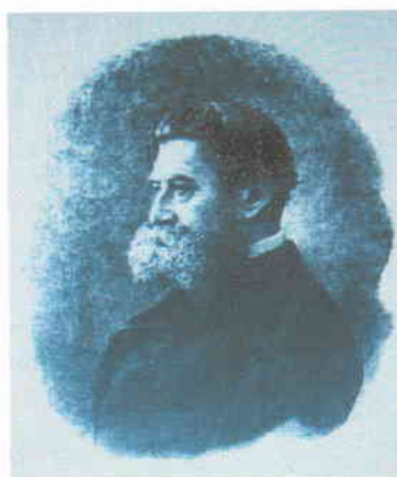
А.В. Сухово-Кобылин, русский писатель, драматург