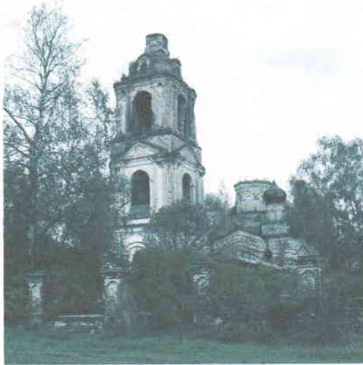
Село Правдино. Церковь Покрова.