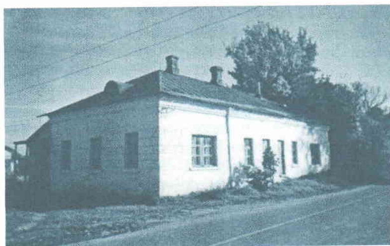
Усадьба «Новинское» Флигель