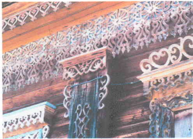
Деревня Правдино. Фрагмент дома. Работа сицкарей.