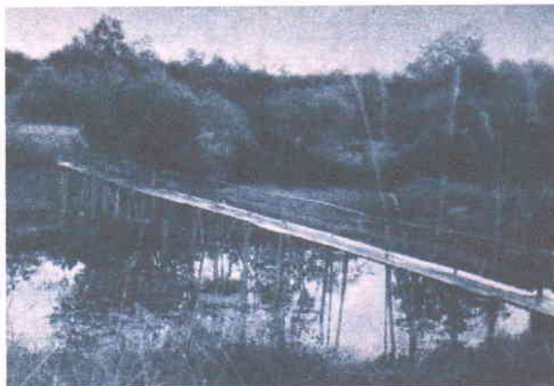
Лавы. Деревня Жарки.