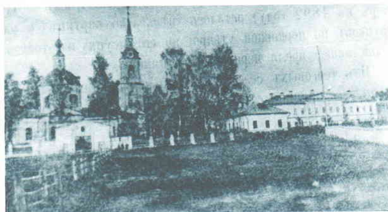
Усадьба «Новинское» Старое фото